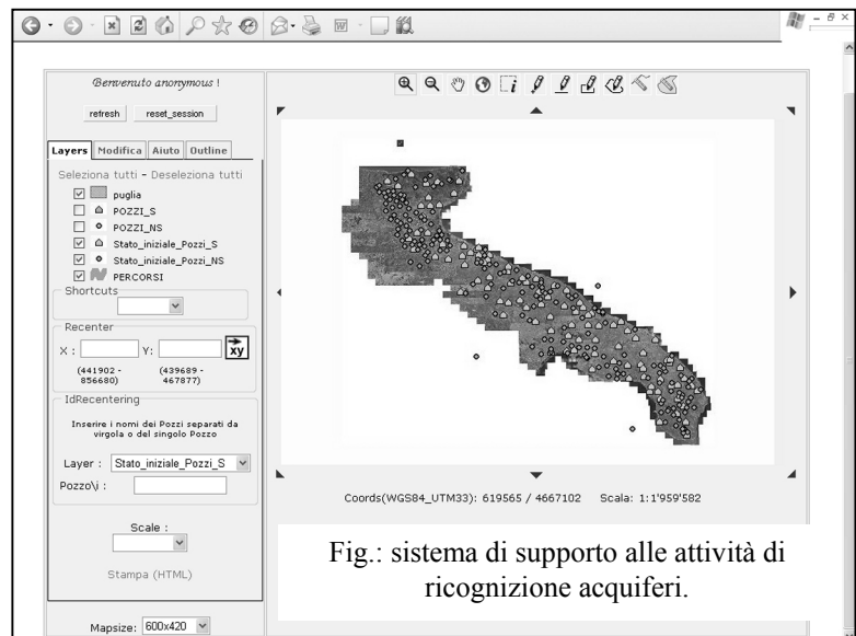
Fig.: sistema di supporto alle attività di ricognizione acquiferi.

L'attività di monitoraggio prevede anche un rilievo aereo, coadiuvato da una campagna a mare per un riscontro diretto e una migliore interpretazione dei dati telerilevati. Il rilievo aereo consente di evidenziare le modificazioni indotte dalle sorgenti costiere sul regime di deflusso in seguito all'intensa attività di emungimento (estrazione dei liquidi dal sottosuolo) delle falde per uso irriguo, nonché le modificazioni indotte da eventuali scarichi a mare sulla clorofilla e la torbidità delle acque.